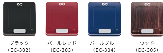
ブラック (EC-302) パールレッド (EC-303) パールブルー (EC-304) ウッド (EC-305)