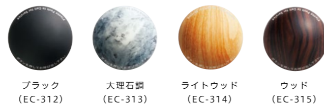
ブラック (EC-312) 大理石調 (EC-313) ライトウッド (EC-314) ウッド (EC-315)